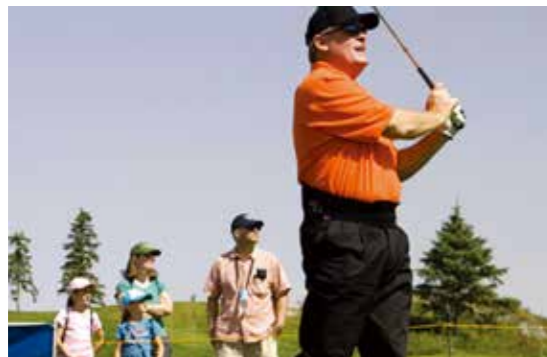
Johnny Miller 世界高球名人堂中的名人