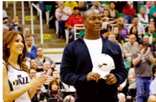
Edgar Rentería (MVP) 2010年美國職棒世界大賽最有價值球員