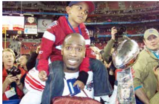
Sam Madison (美式足球) 超級盃冠軍賽選手