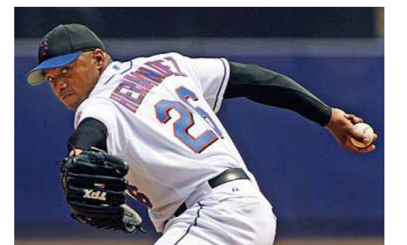
Orlando Hernández 職業棒球選手