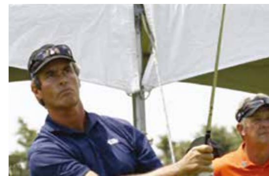
Ian Baker-Finch 高球四大巡迴公開賽得獎人