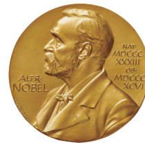
1998年 ノーベル生理学・医学賞

1998年、心筋系に存在する「シグナル伝達分子」の存在を発見したことにより、3名の科学者がノーベル生理学・医学賞を受賞しました。この発見は、心血管医学の歴史における最大の発見とも呼ばれています。そのシグナル伝達分子の正体が「一酸化窒素」です。