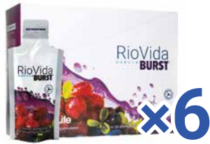
4Lifeトランスファーファクター® リオヴィーダ® ジェル トライファクター® 小売セット

小売販売に便利でお得なセットができました!どれも単品での購入に比べて約25%OFF。ぜひ、小売販売にご活用ください。ご家族でのご愛用にもおすすめです。小売セットは、4Life会員のみご購入いただけます。MyShop注文は対象外です。