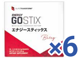
エナジースティックス・ベリー 小売セット