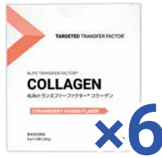
4Lifeトランスファーファクター® コラーゲン 小売セット